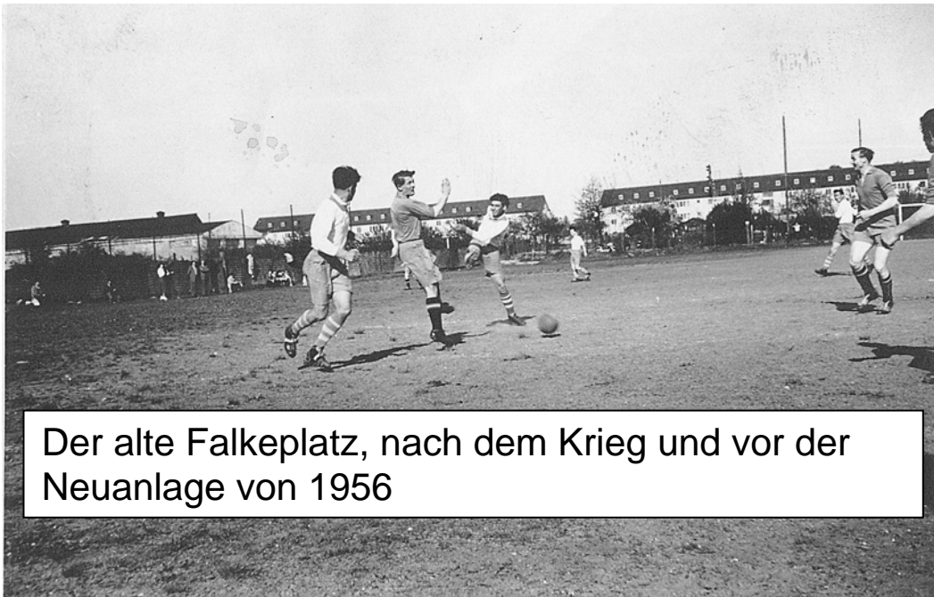
Der alte Falkeplatz, nach dem Krieg und vor der Neuanlage von 1956